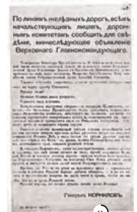
Универсал генерала Корнилова.